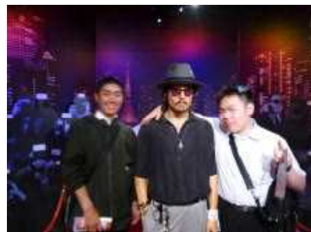
「オレの親友を紹介します。」 蠟人形館マダム・タッソーにて。