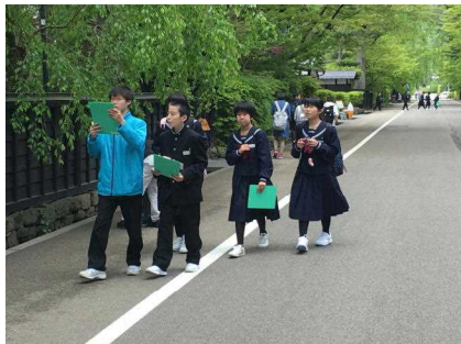
グループごとに武家屋敷を散策して、歴史ある町並みを実感。