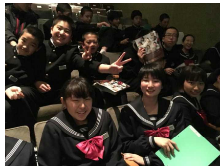
ミュージカル「ジパング青春記」の開演前。ワクワクです。