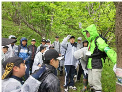
小雨の中でのトレッキングでしたが、自然の素晴らしさを再発見。