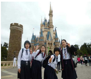
満喫した ディズニーリゾート。 「楽しい時間よ止まれ！」