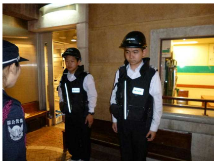
キッコーン東京での勤労体験。 「東京2020は私が守ります。」