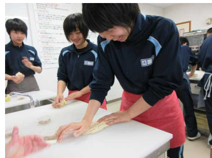
白神ピッツアの作成中です。予想以上においしくできました。