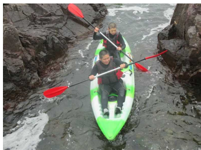
初めてのシーカヤック。あっという間に慣れました。