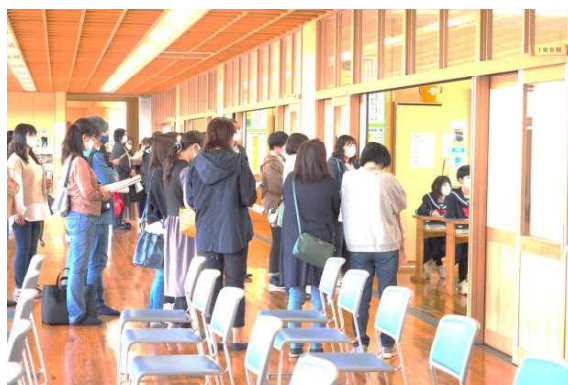
○4/16 PTA 授業参観