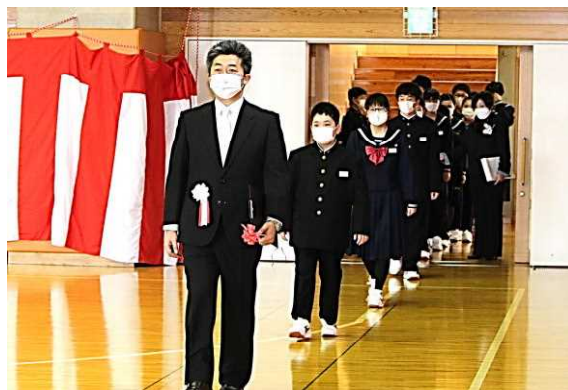
○4/7 入学式 新入生入場